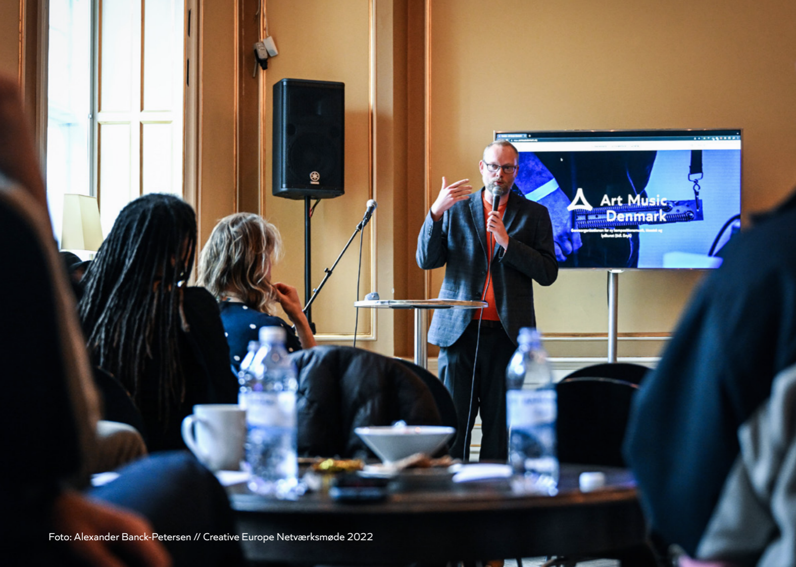
Creative Europe Netværksmøde 2022