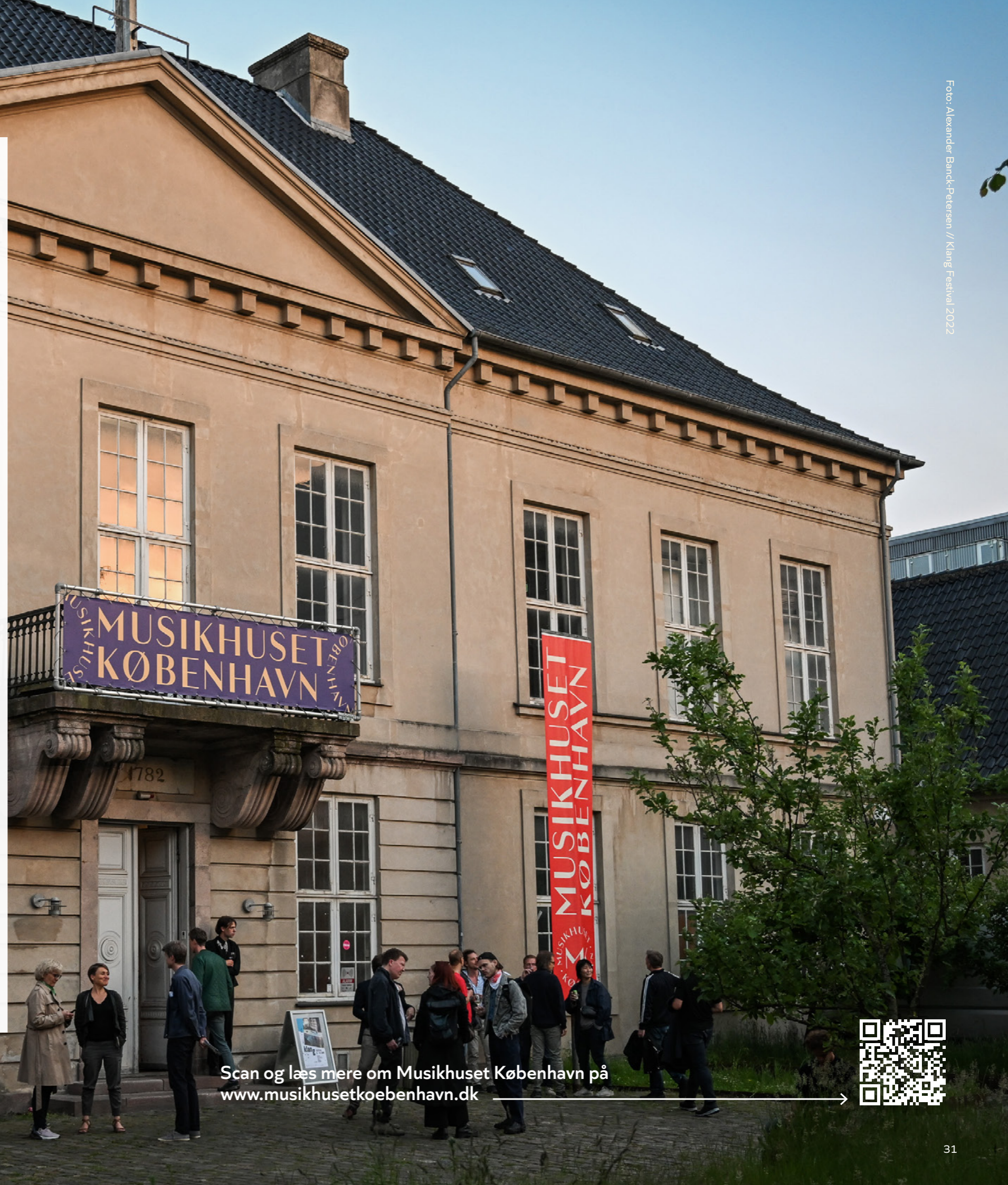
Klang Festival 2022

Art Music Denmarks tætte partnerskab med Musikhuset København afsluttes i 2023. Frem til da udvikler vores organisationer sig sammen og samarbejder om en række pilotprojekter, som bl.a. skal fremme danske ensembler, festivaler og kulturarv. Et eksempel på et sådant pilotprojekt er "Musikhuset VÆKST" der har til formål at skabe et miljø for unge ensembler, som mangler prøvofaciliteter og egnede steder at mødes for at udvikle koncerter, koncepter og holde prøver. Idéen er at ensemblerne hver for sig skal udvikles, men at der også skal opstå samarbejder på kryds og tværs indbyrdes samt med andre aktører i Musikhuset København. I efteråret udvalgte et musiksagkyndigt panel et antal ensembler, der vil indgå i projektet i 2023. "Musikhuset VÆKST" er støttet af bl.a. Det Obelske Familiefond.