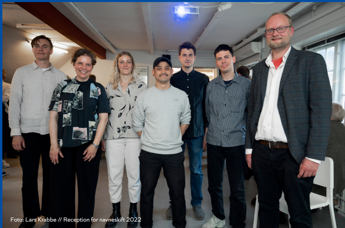
Reception for navneskift 2022

For ny kompositionsmusik-miljøet har "Snyk" altid haft en særlig betydning: Som sparringspartner, facilitator og eksperimentator. Det er denne lange arv, der udgør det fundament, Art Music Denmark bygger på. Det er naturligvis vores ambition at være til for alle vores genrer. Den nye kompositionsmusik vil fortsat have et centralt fokus.