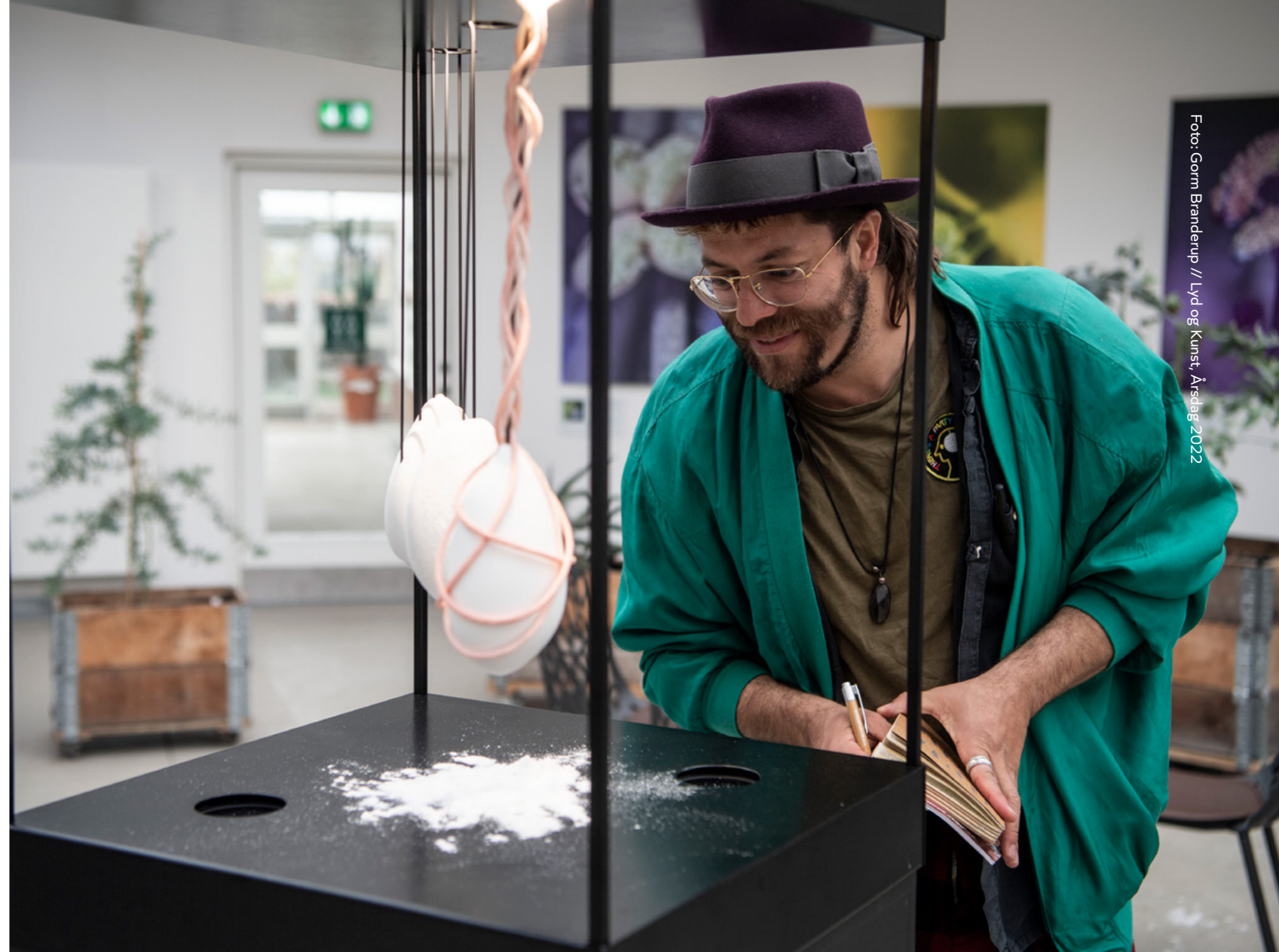
Årsdag 2022